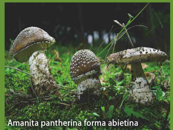
Amanita pantherina forma abietina