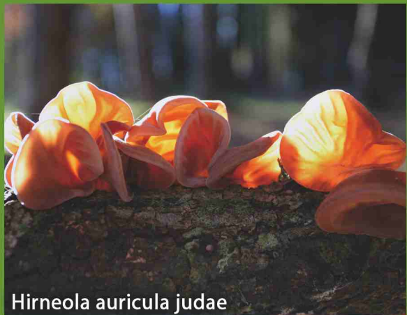
Hirneola auricula judae